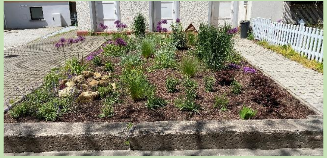
Beispiel für „Vorher-Nachher“ vom Stadtgrün-Wochenende 2020